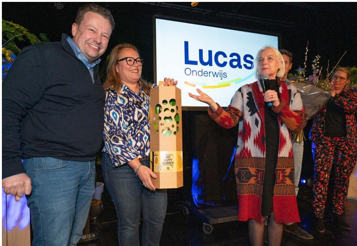
Op de foto: uitreiking Lucas Onderwijsprijs 2023 (januari 2024)

Elke commissie heeft twee leden (een voorzitter en een lid). Alle leden van de raad van toezicht maken deel uit van één commissie.